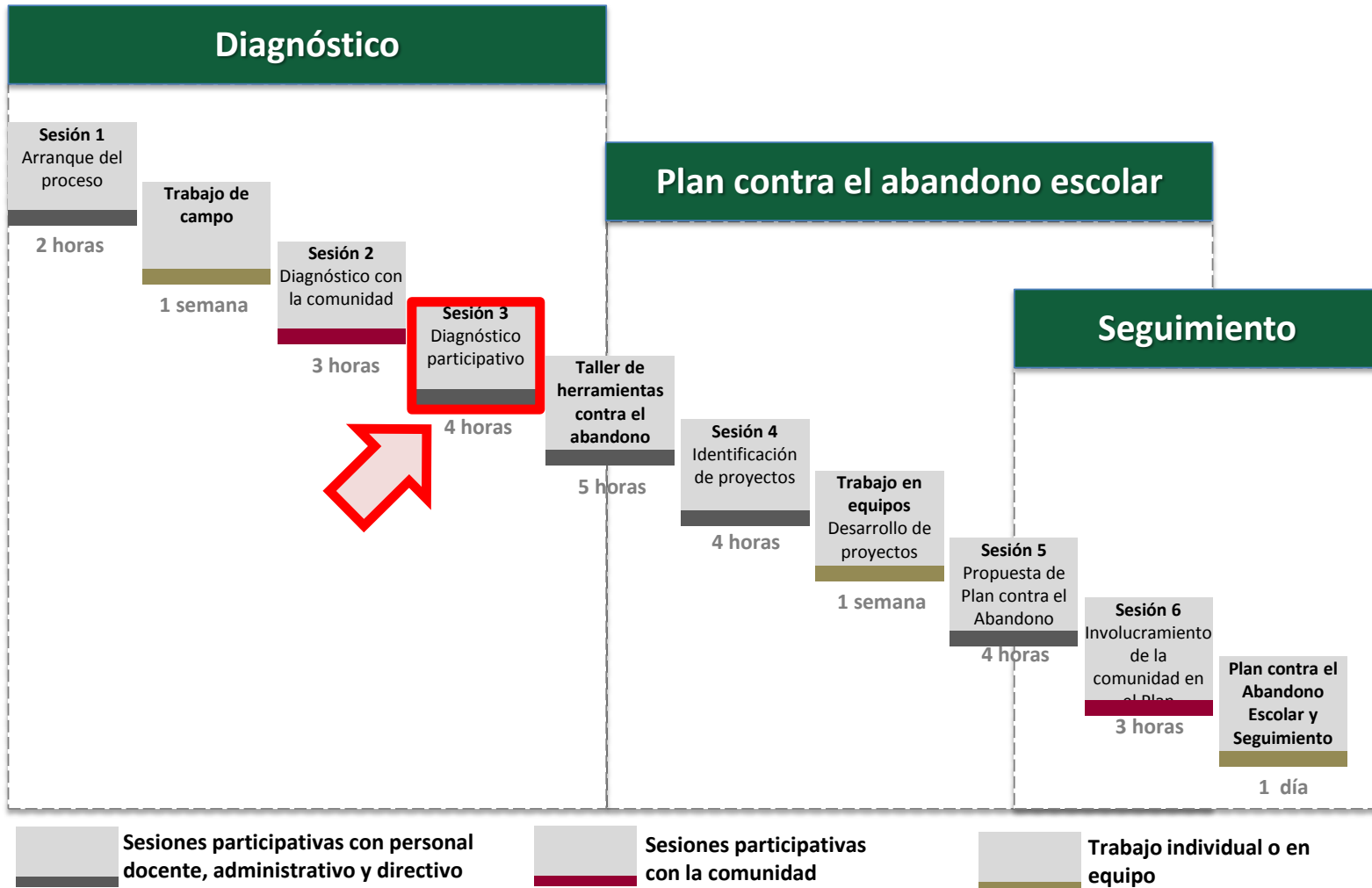
Diagrama: Proceso de Planeación Participativa